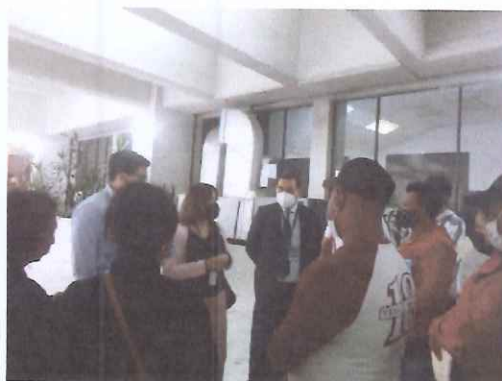
Asesoría en la conformación de expedientes.